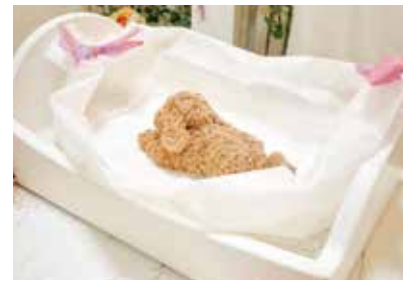
天使のひつぎ (キャンディコフィン) 焼却灰がほとんどでない、 環境に配慮したひつぎです。